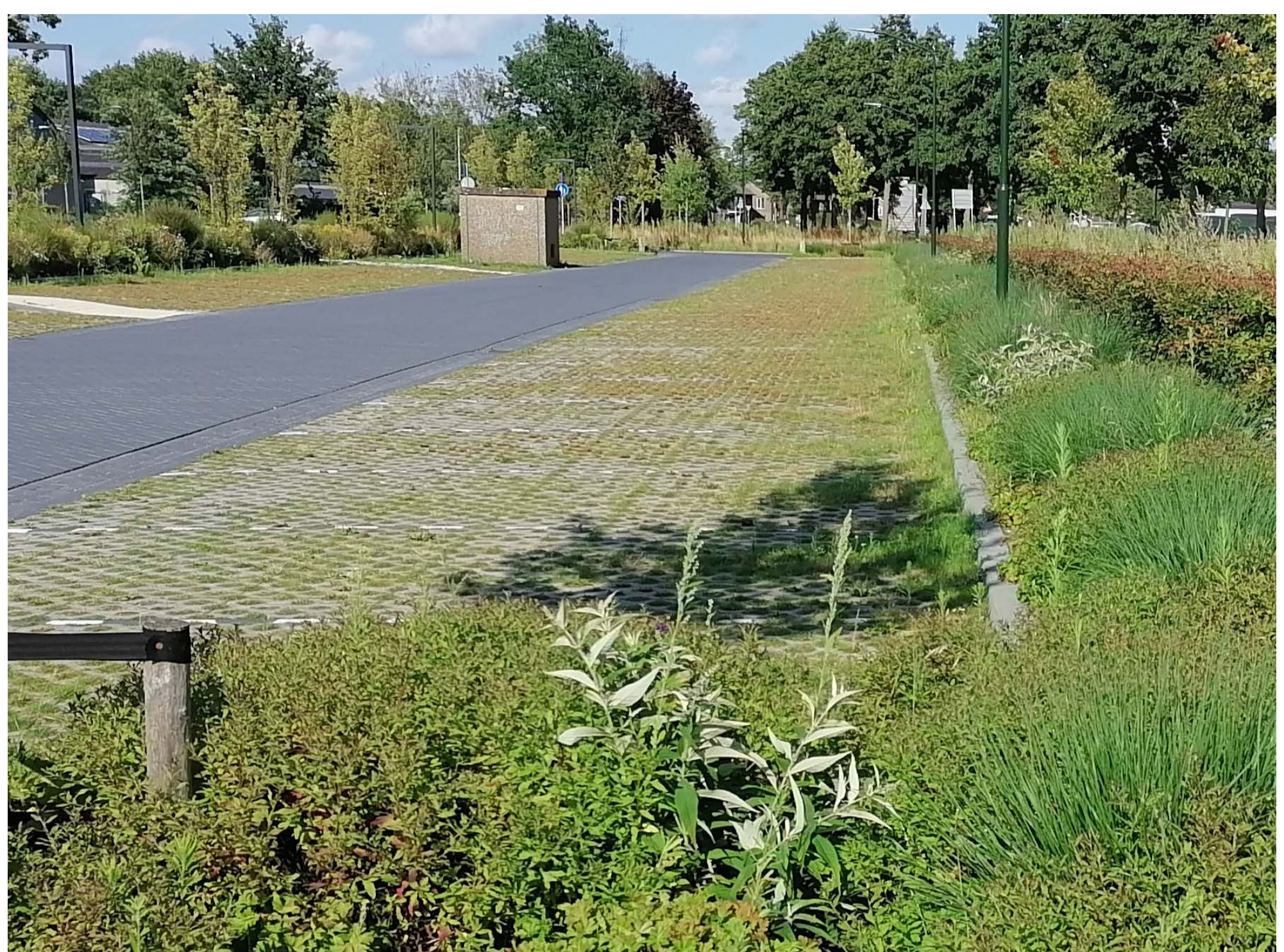
Figuur 7: Groen parkeren waar mogelijk