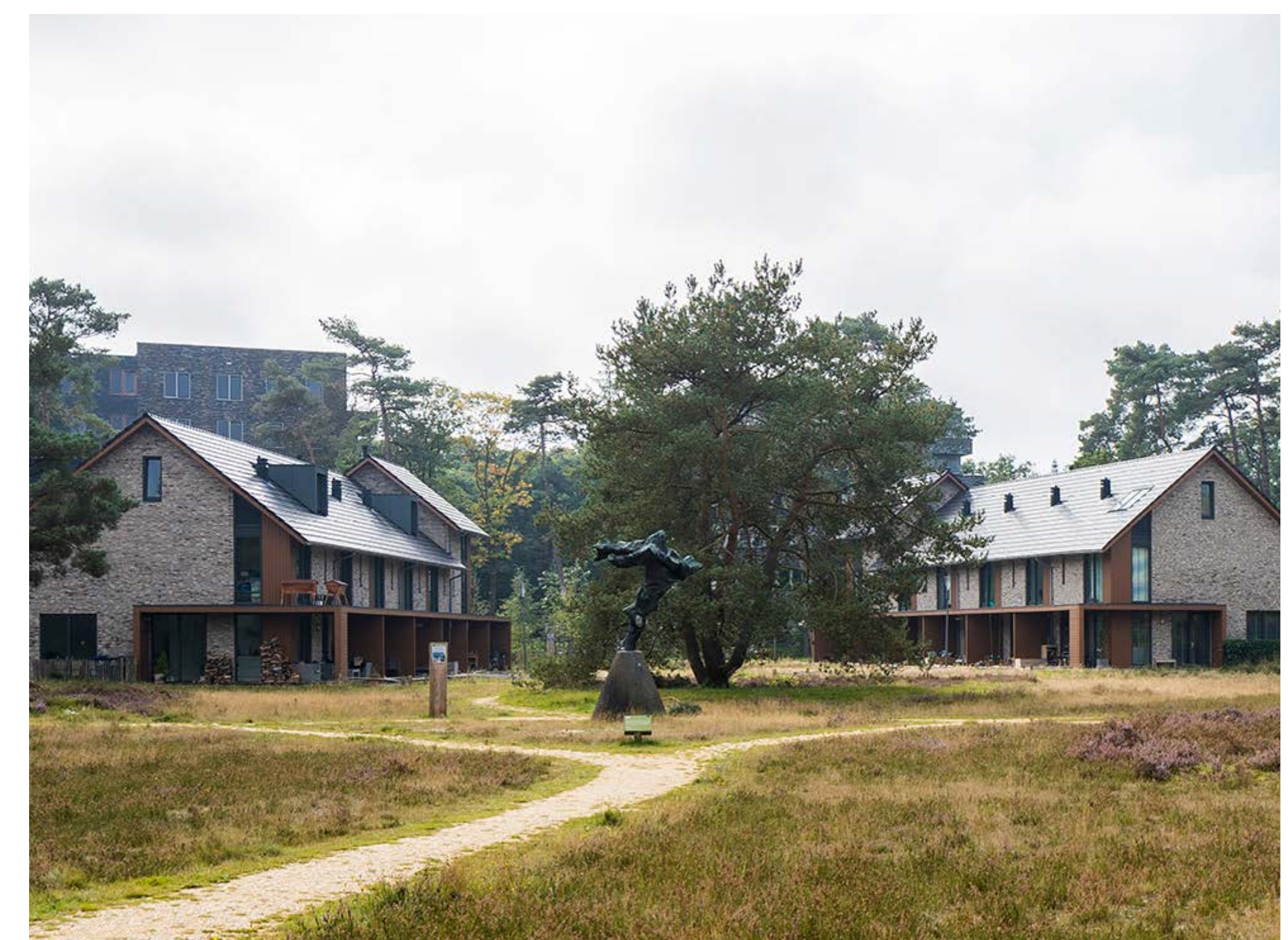
Figuur 9: (semi-)onverharde padenstructuur in parkzone