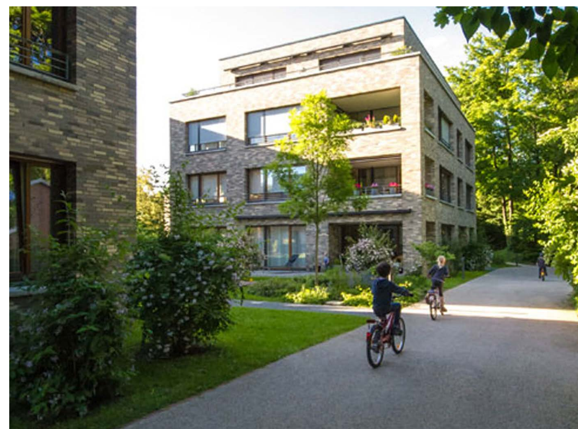
Figuur 8: Autoluw straatprofiel