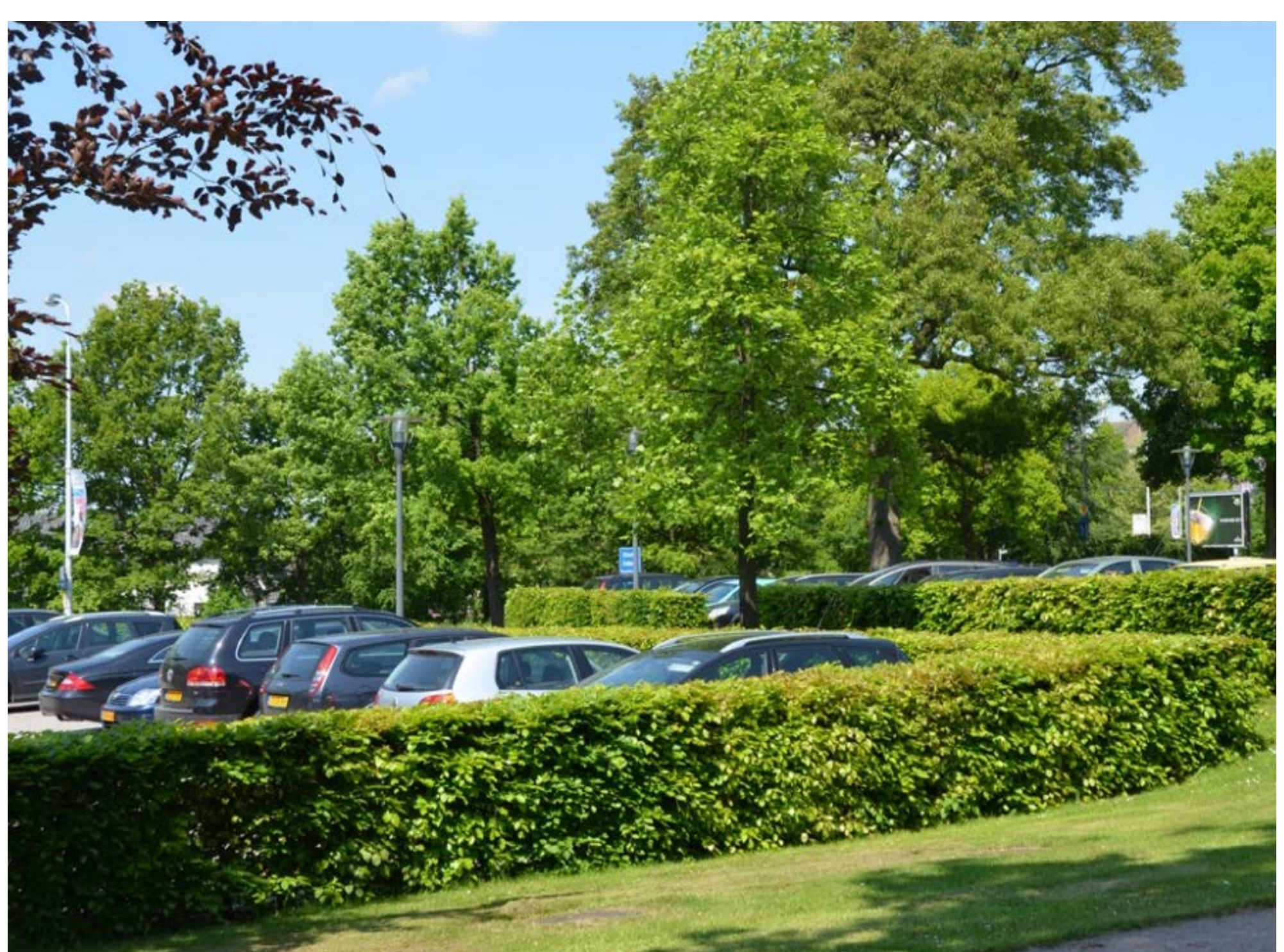
Figuur 10: Parkeren wordt groen omkaderd met bladhoudende hagen