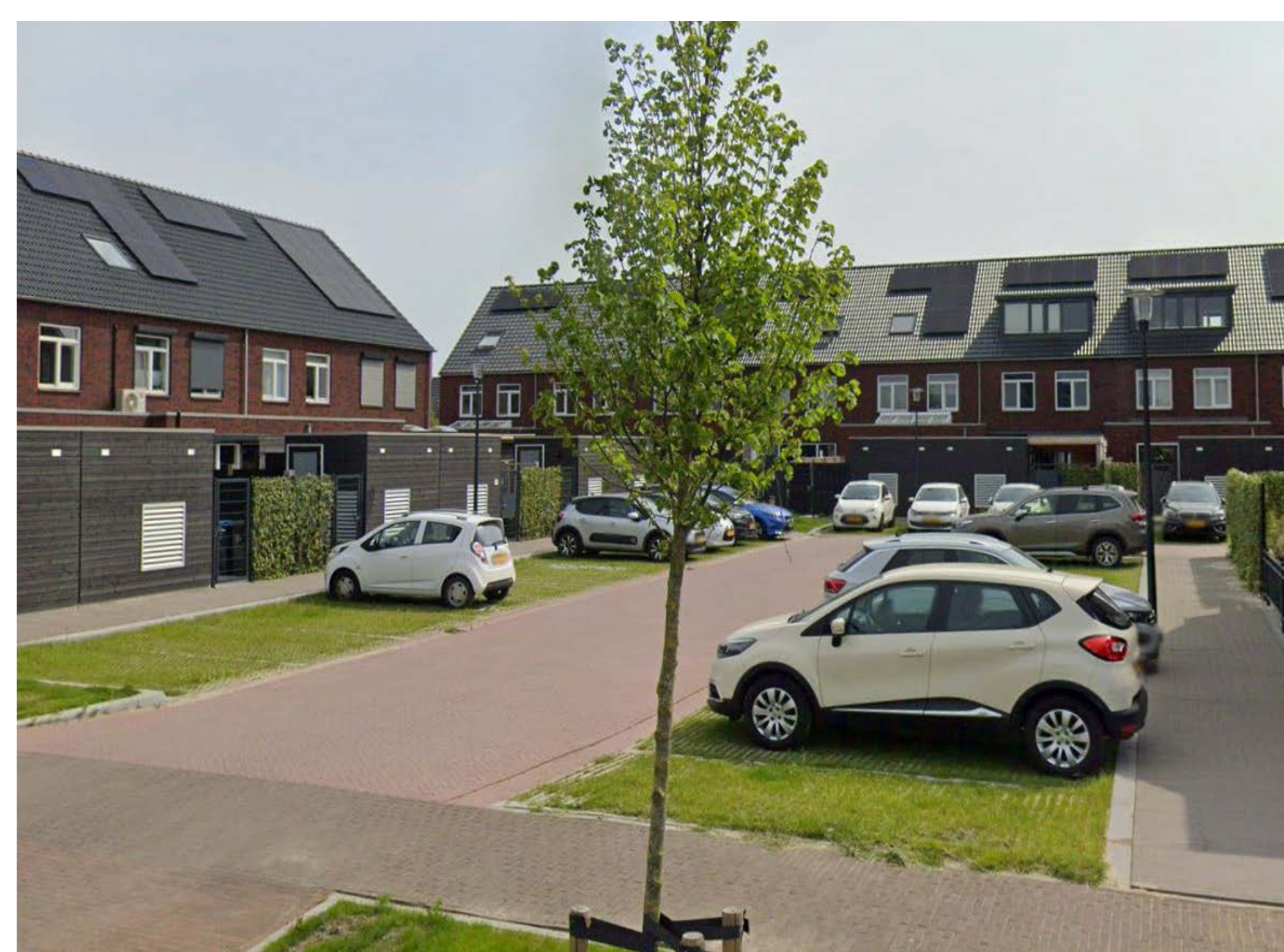
Figuur 11: Parkeren in hofjes met eigen achterom