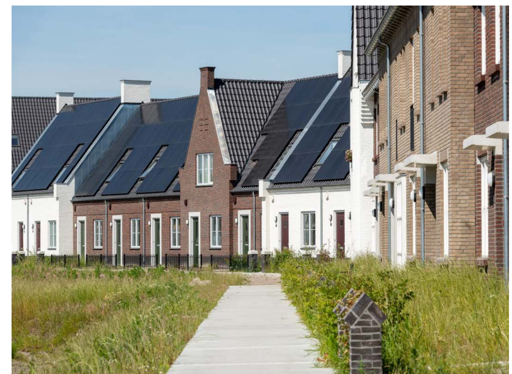
Figuur 3: Variatie in kleur, kapvorm en rooilijn