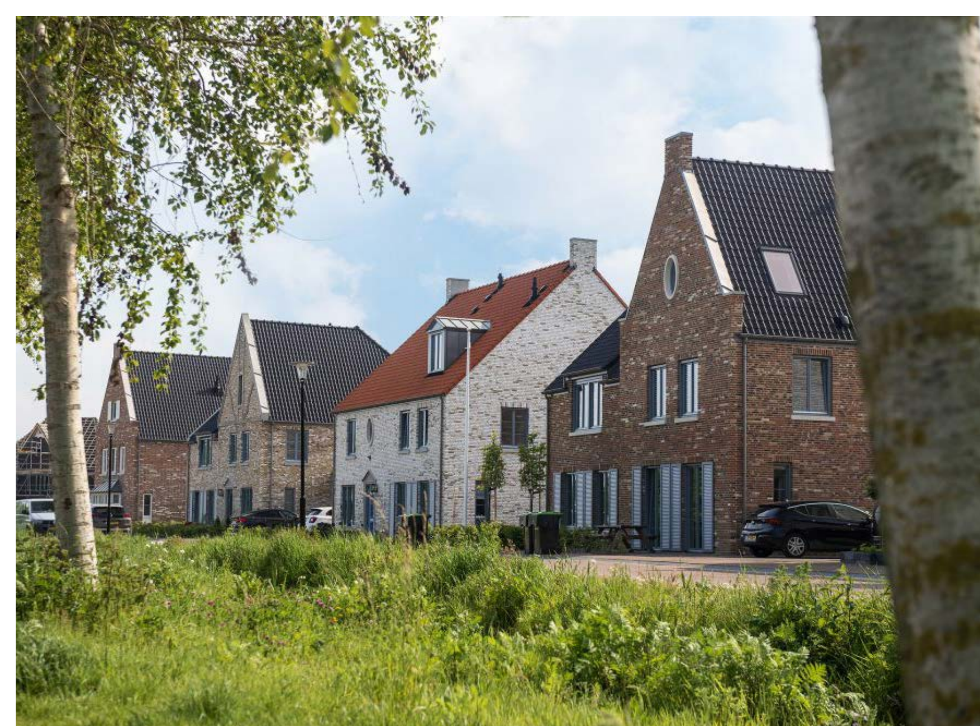
Figuur 5: Dorps karakter en eigenheid