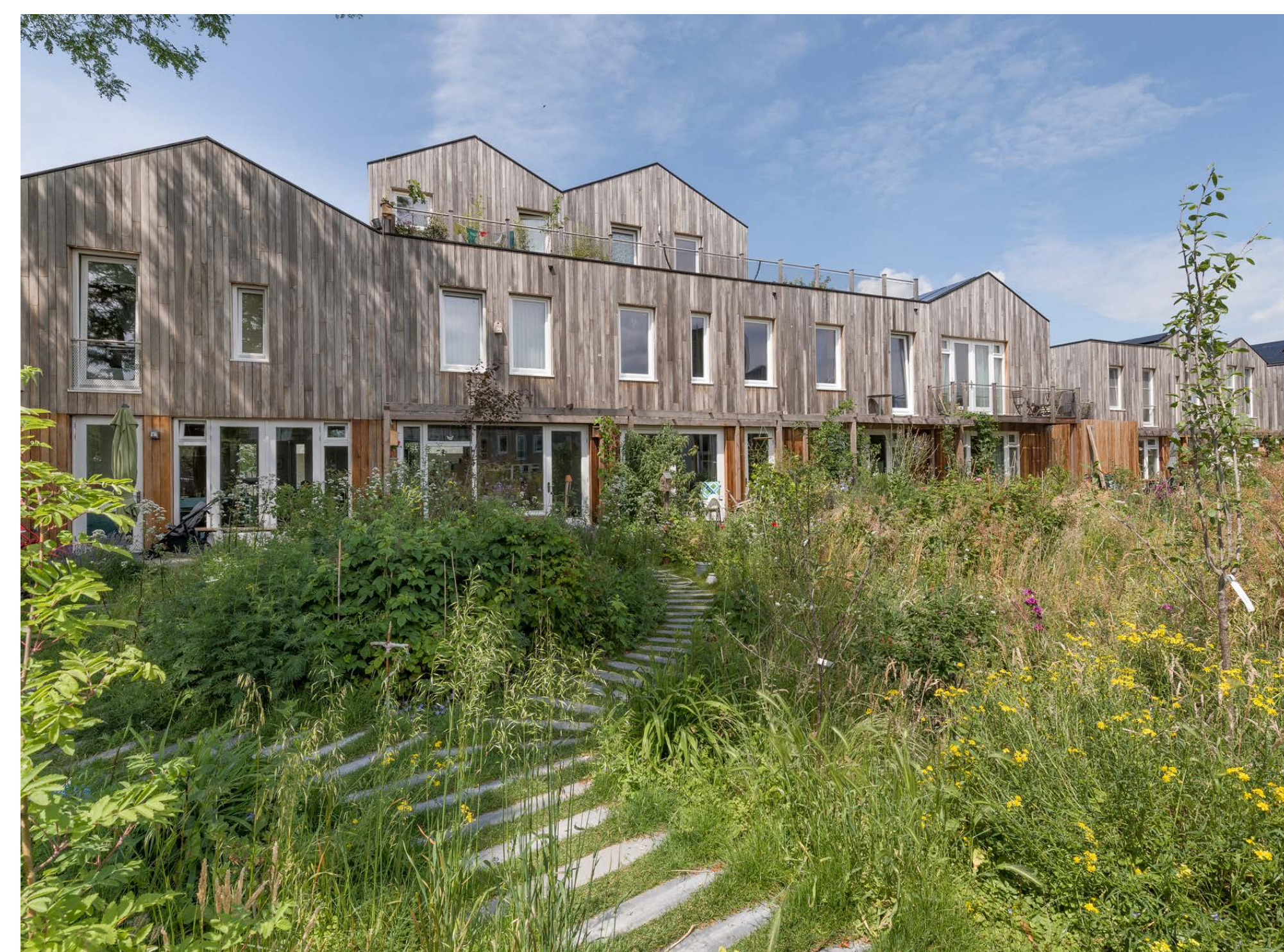
Figuur 2: Gebruik van natuurlijke materialen