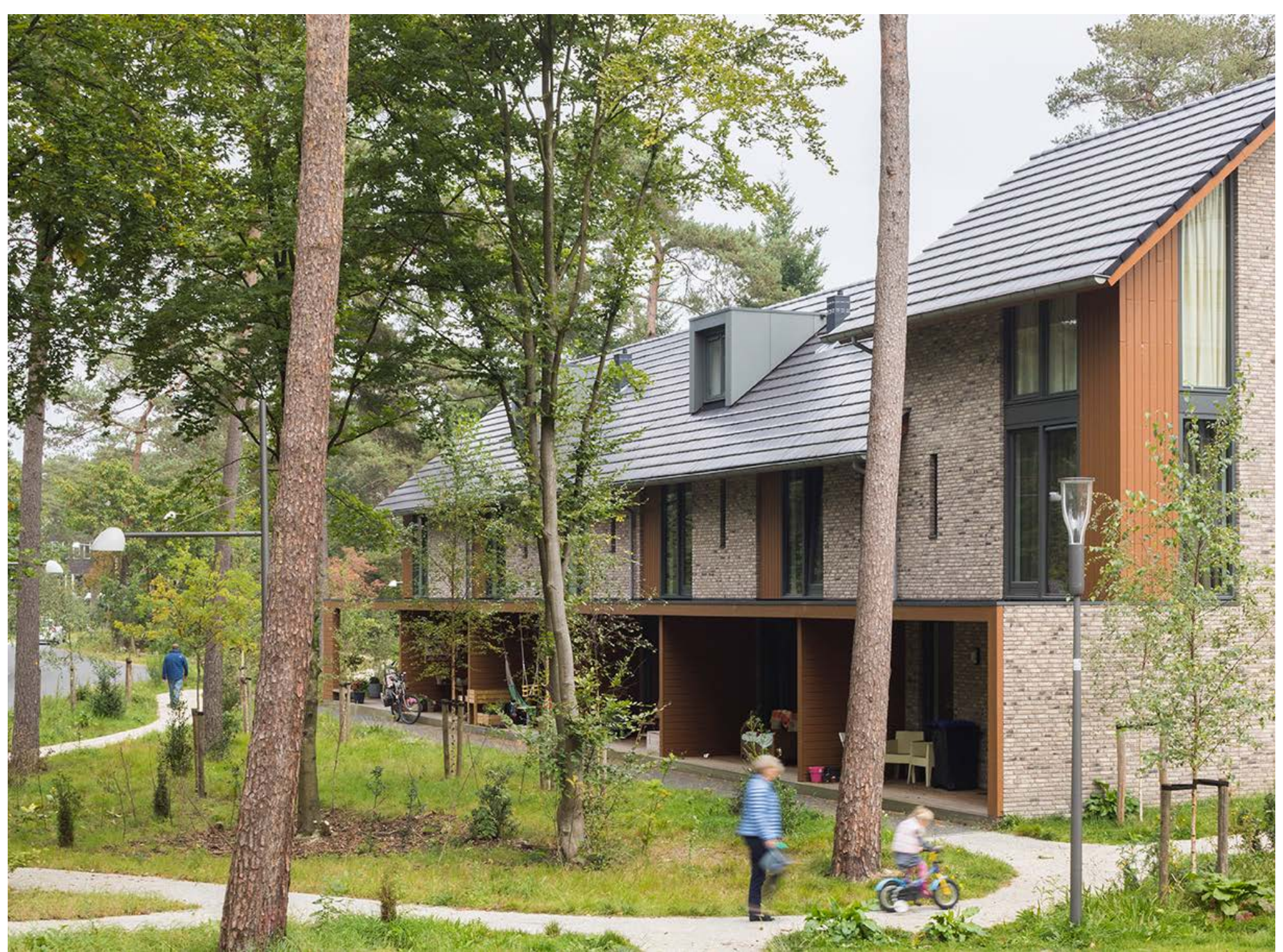
Figuur 1: Overgang park en wonen