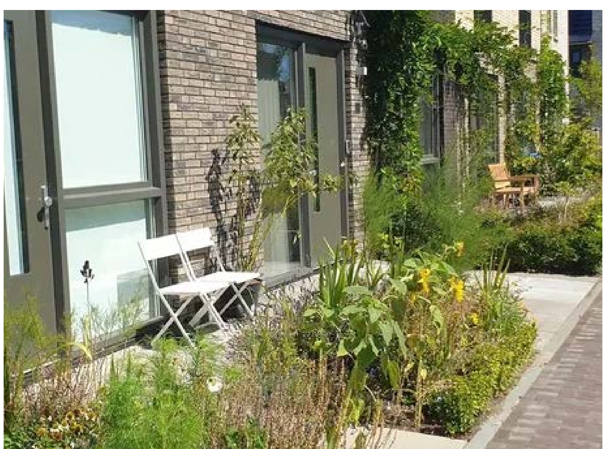
Figuur 4: Kleine voortuintjes met groene gevels