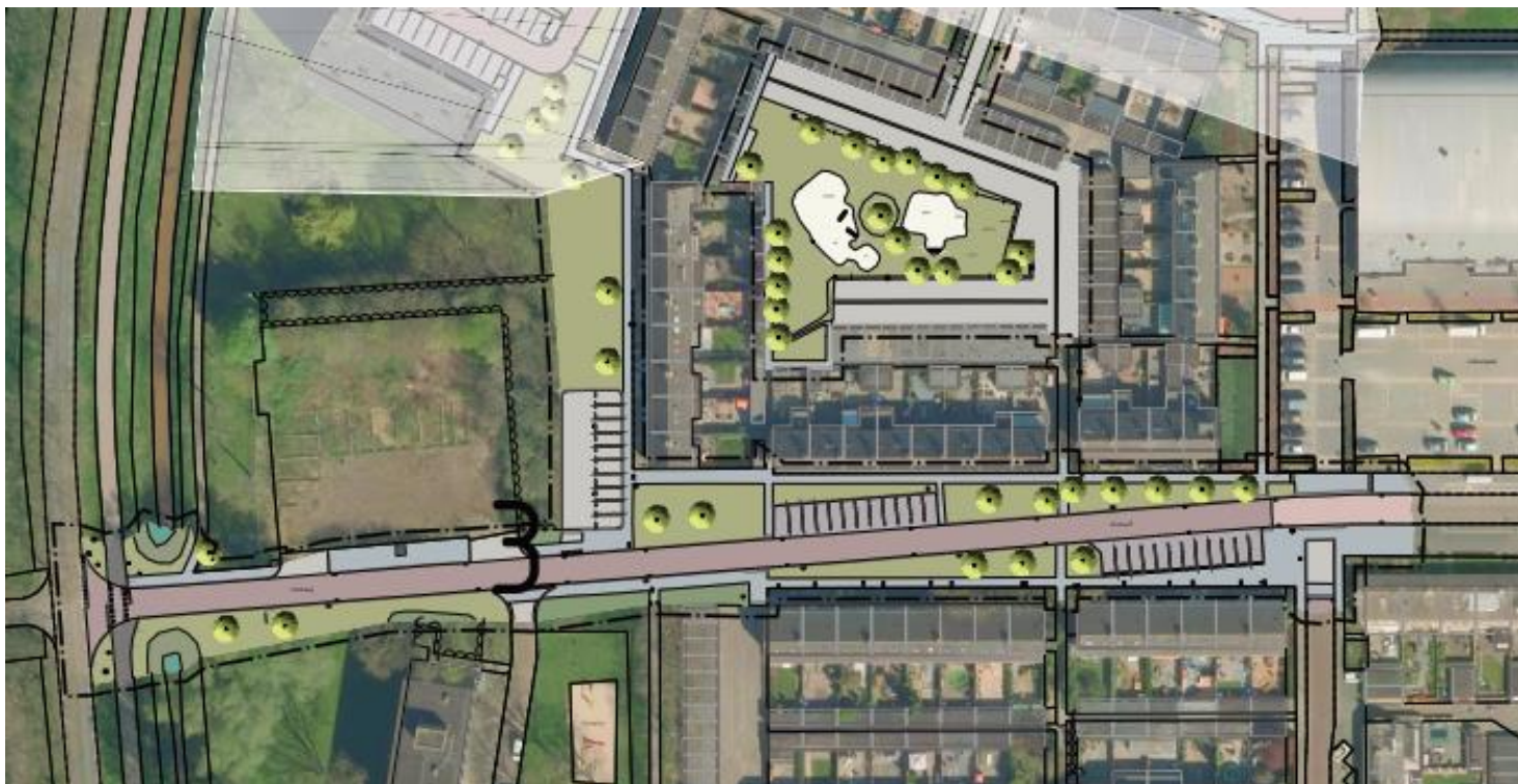
Groep 3: Stadsweg en Ravelijn, deel dat aan de Stadsweg grenst