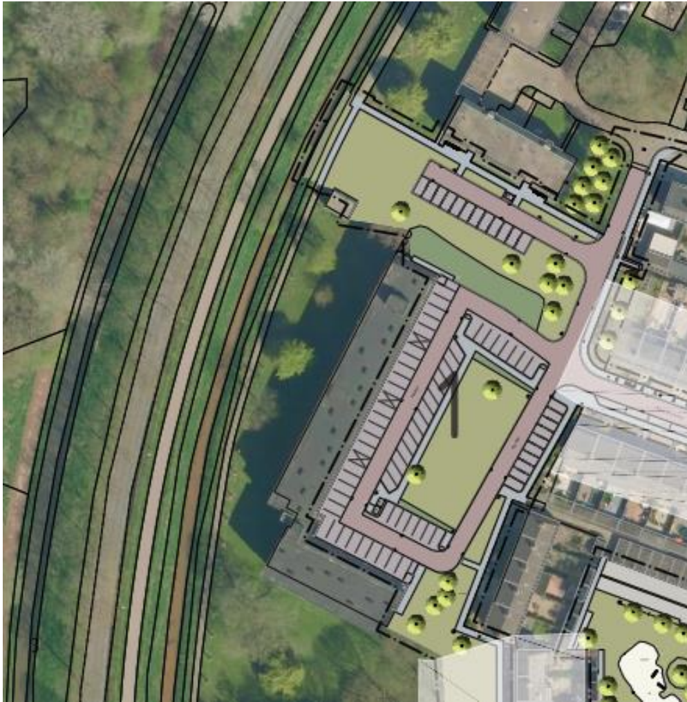
Groep 1: Ravelijn