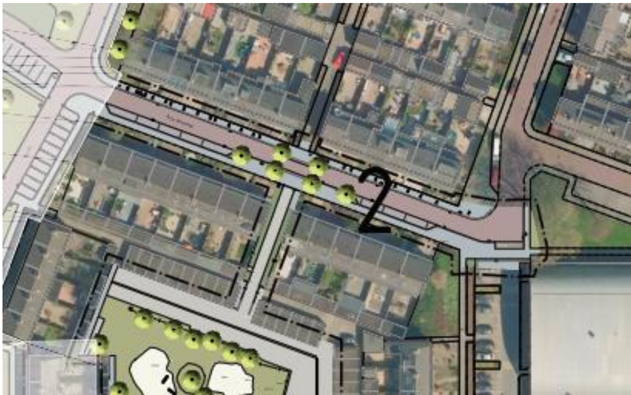
Groep 2: Burg. Bianchiweg incl. binnenterrein