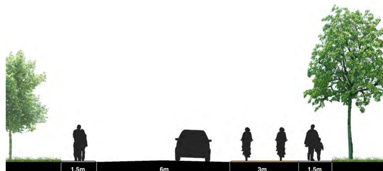
Optie 1x 2-richtingsfietspad, 2x voetpad